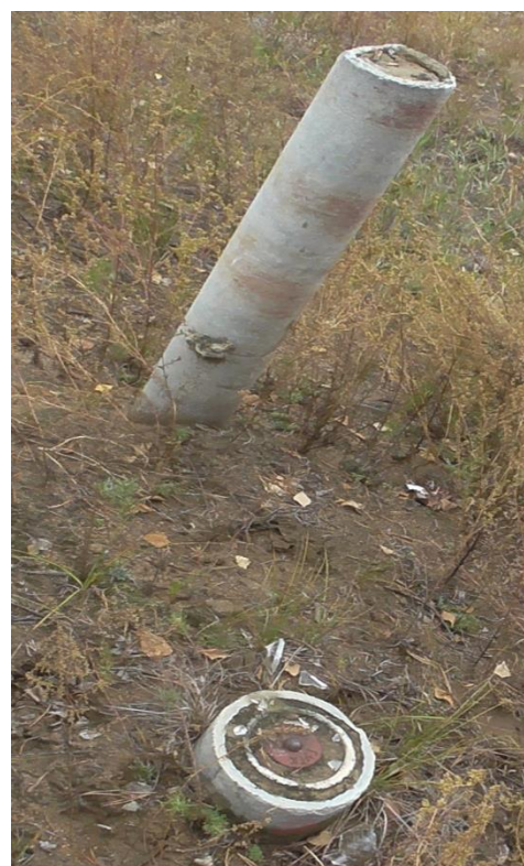
Центр с опознавательным столбом