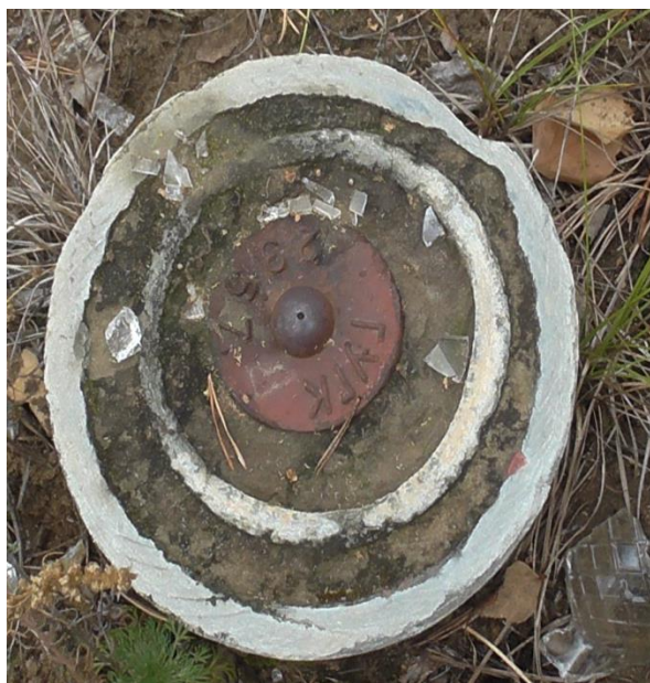
Вид центра пункта.